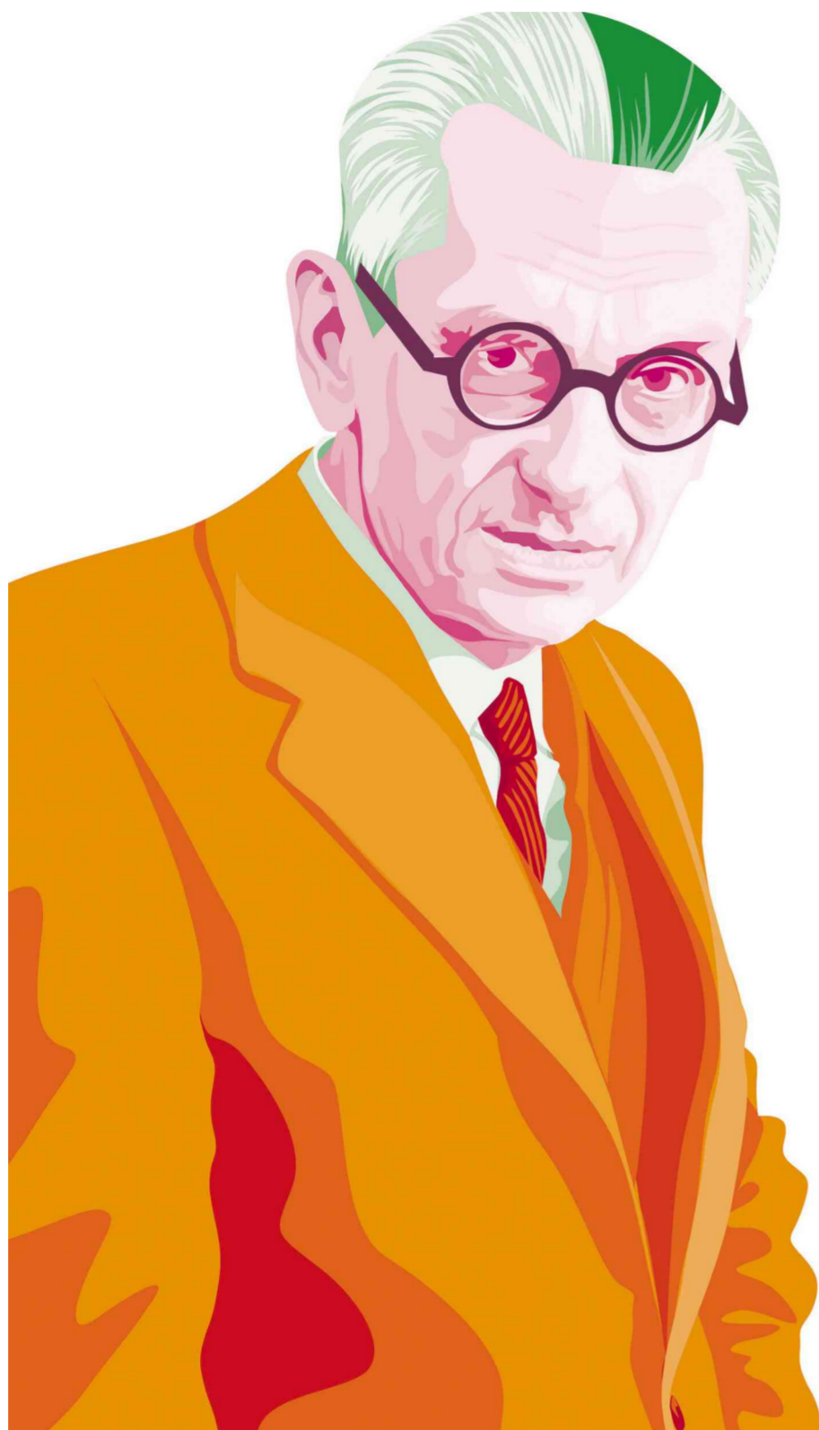
Vor Kriegsbeginn emigrierte er nach Amerika: Kurt Gödel (1906 bis 1978)