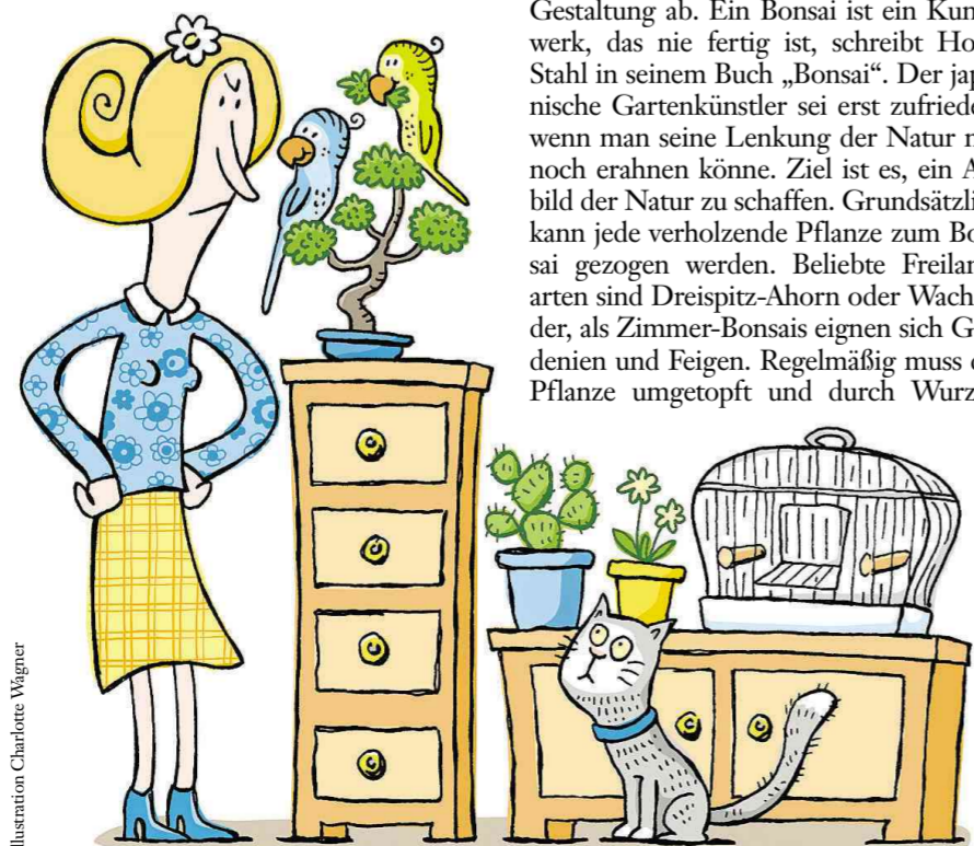
Illustration: Charlene Wagner

kauft. Es gibt auch einen Schwarzmarkt, wie ein Raub in Kawaguchi bei Tokio zeigt: Anfang des Jahres stahlen kundige Diebe sieben Bonsais im Wert von mehr als 100 000 Euro, darunter einen rund 400 Jahre alten Shimpaku-Baum. Der Preis der Minibäume hängt auch von der Gestaltung ab. Ein Bonsai ist ein Kunstwerk, das nie fertig ist, schreibt Horst Stahl in seinem Buch „Bonsai“. Der japanische Gartenkünstler sei erst zufrieden, wenn man seine Lenkung der Natur nur noch erahnen könne. Ziel ist es, ein Abbild der Natur zu schaffen. Grundsätzlich kann jede verholzende Pflanze zum Bonsai gezogen werden. Beliebte Freilandarten sind Dreispitz-Ahorn oder Wacholder, als Zimmer-Bonsais eignen sich Gardenien und Feigen. Regelmäßig muss die Pflanze umgetopft und durch Wurzel-